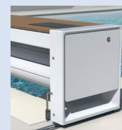
Version SOLAIRE mobile sur rails sans habillage

Un kit composé d'un panneau solaire intégré dans l'habillage supérieur + un régulateur de charge + une batterie de 24V.