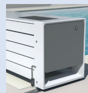
Version SOLAIRE mobile sur rails avec habillage